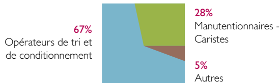
Répartition des saisonniers selon le métier exercé

62% des entreprises ont recours à l'emploi saisonnier et 76% d'entre elles ont embauché un saisonnier présent l'année précédente