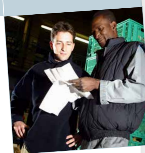
Les fiches métiers au cœur de vos ressources humaines